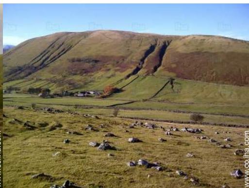
vista sobre el campo