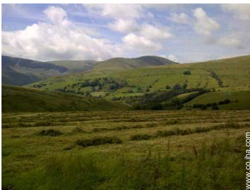
vista sobre el campo