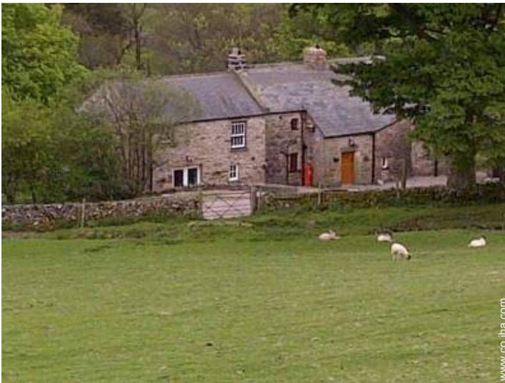
vista sobre campos agrícolas