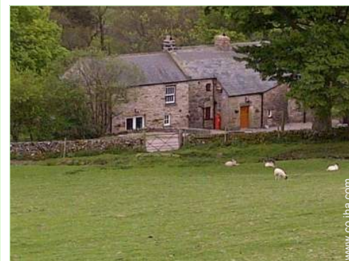
vista sobre campos agrícolas

Centro del pueblo 5km El centro 10km Alquiler de bici/MTB 10km Panadería 10km Pequeños comercios 10km Supermercado 10km Peluquería 10km Correos 10km Banco 10km Cajero automático 10km Farmacia 10km Doctor 10km Hospital 30km Dispensario 10km