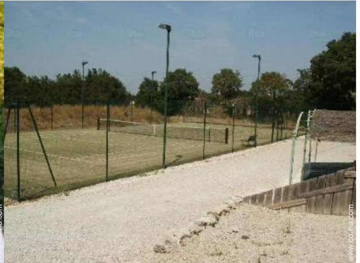
Tenis - cesped