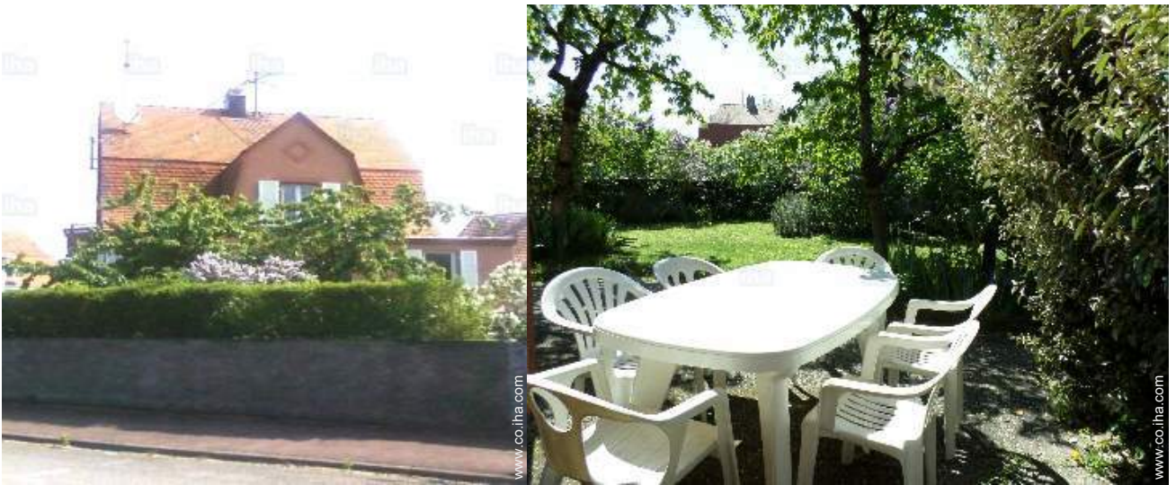
vista sobre el jardin/parque