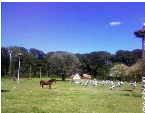
parque y jardín