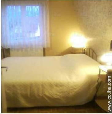
camas gemelas sencilla