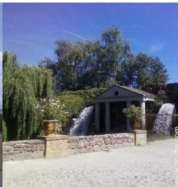
Zonas atractivas y relajación