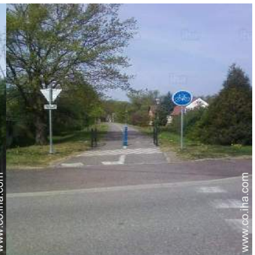
MTB (itinerario circuito)