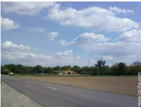
paseo a caballo