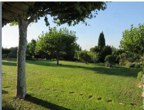
vista sobre el jardin/parque