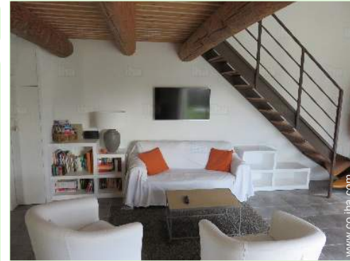
cuarto de estar

Parrilla a gas, mesa(s) de jardín, 4 silla(s) de jardín, cenador, sombrilla, área de jardín, 4 tumbona(s), ducha exterior