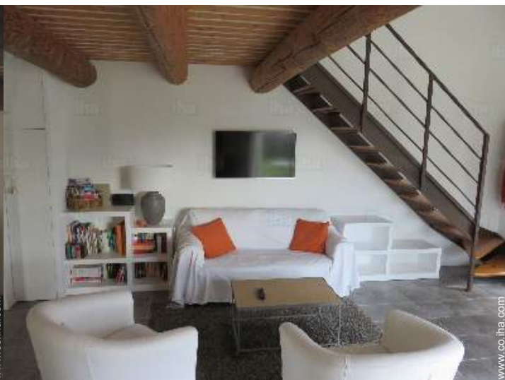
cuarto de estar