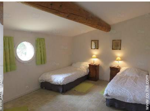
cama de matrimonio