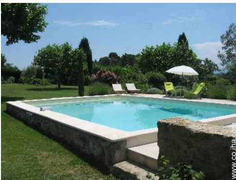
vista sobre la piscina