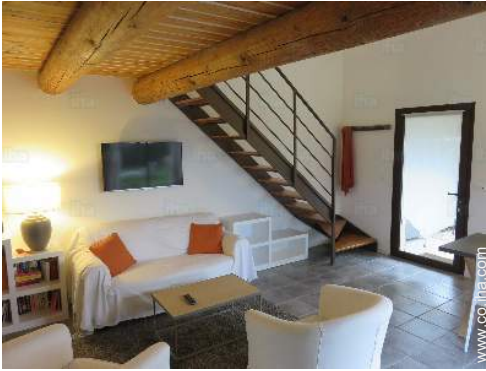
cuarto de estar