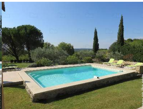
vista sobre la piscina