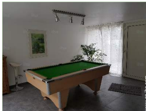
Instalaciones de ocio

Niños bienvenidos Animales no aceptados Alquiler no fumador