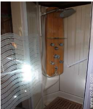
Confort interior a disposición de los huéspedes