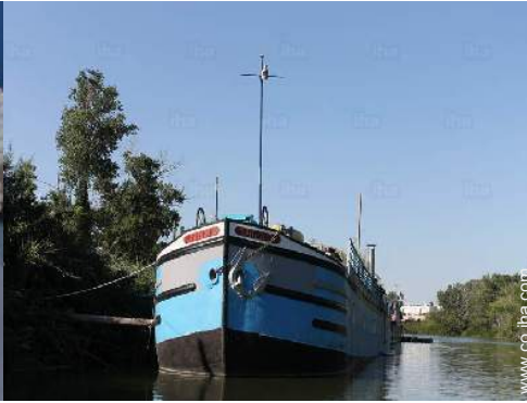
vista sobre el río