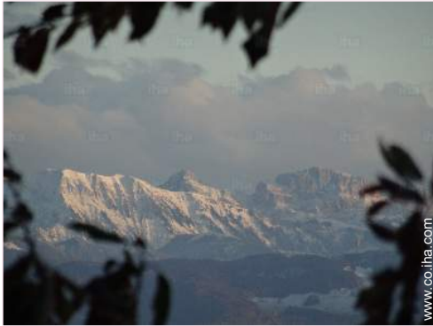
vista sobre la montaña