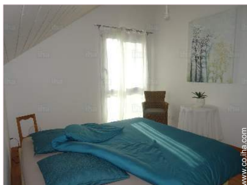
La habitación de huésped